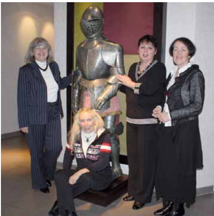
Liebreizende Damen der RIGO umschwärmten den stattlichen Ritter, die Symbolfigur des Hotel RITTER Durbach